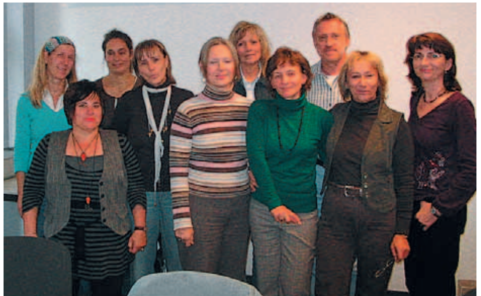
Die ersten Lehrkräfte in Brandenburg 2007

Philosophie, Psychologie, Kulturwissenschaften und Religionswissenschaften und schließlich die Fachdidaktik Humanistische Lebenskunde.